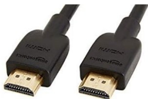
Obrázek 3: kabel HDMI