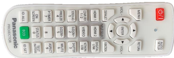
Obrázek 1: ovladač projektoru

Projektor se zapíná a vypíná dálkovým ovladačem – červené tlačítko (nebo vypínačem přímo na projektoru). Tento ovladač neslouží k výběru zdroje signálu (správný zdroj je HDMI 1).