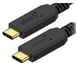
Obrázek 4: kabel USB-C