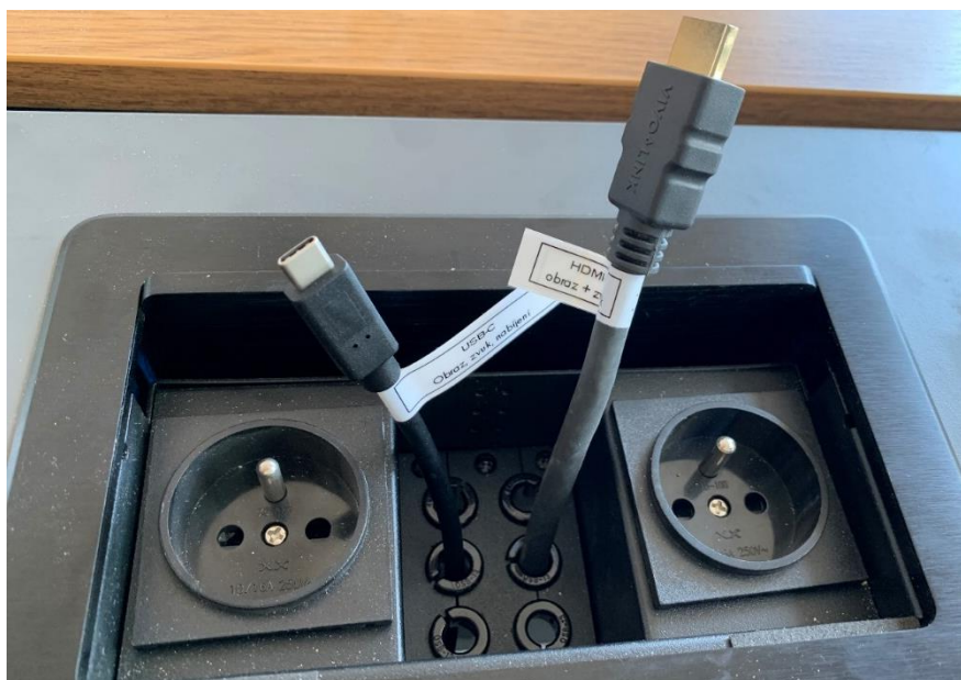
Obrázek 5: přípojné místo s vytahovacími kabely

Možnost připojení obrazu a zvuku kabelem HDMI nebo USB-C – viz označení na kabelu (rozhraní USB-C poskytuje navíc i připojení k internetu a nabíjení – max. 60 W)