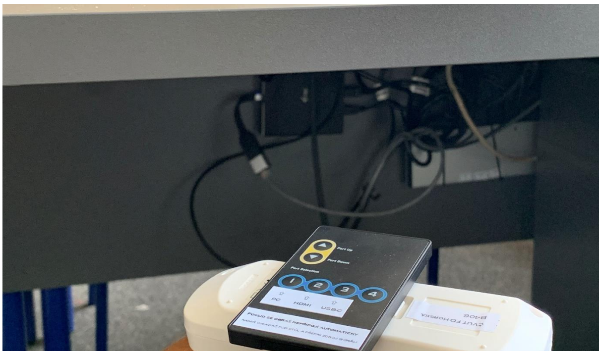
Obrázek 2: přepínání zdrojů signálu

Pokud projektor hlásí, že nemá signál, použijte malý dálkový ovladač , zamiřte ho pod stůl katedry a párkrát stiskněte požadovaný kanál ( 1 – počítač v katedře, 2 – HDMI, 3 – USB-C).