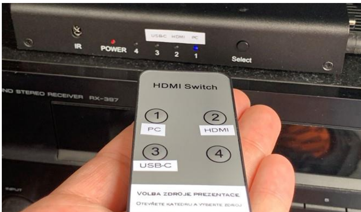
Obrázek 2: přepínání zdrojů signálu

Pokud projektor hlásí, že nemá signál, použijte malý dálkový ovladač , zamiřte ho pod stůl katedry a párkrát stiskněte požadovaný kanál ( 1 – počítač v katedře, 2 – HDMI, 3 – USB-C).