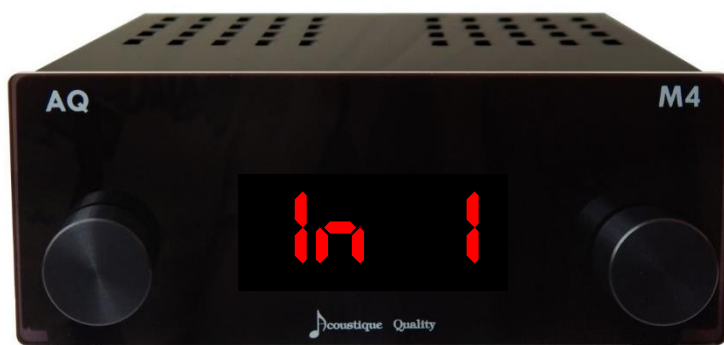
Obrázek 7: zesilovač

Zvuk z PC a HDMI funguje automaticky dle zvoleného zdroje signálu na tlačítkovém ovládacím panelu. Hlasitost zvuku lze regulovat levým kolečkem na zesilovači (obr. 7) nebo v používaném zařízení.