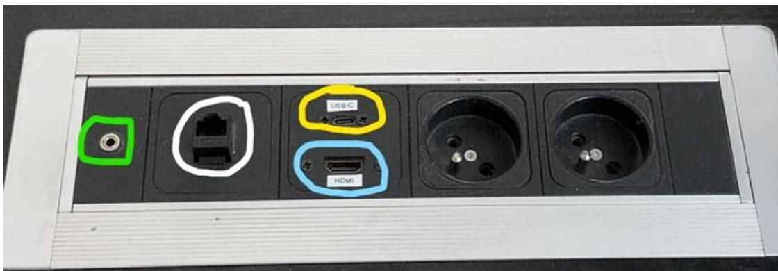
Obrázek 6: přípojné místo

Možnost připojení obrazu a zvuku kabelem HDMI (obr. 6 modře), USB-C (obr. 6 žlutě) nebo pouze zvuku kabelem 3,5 mm jack (obr. 6 zeleně). Rozhraní USB-C poskytuje navíc i připojení k internetu a nabíjení – max. 60 W.