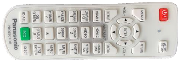
Obrázek 1: ovladač projektoru

Projektor se zapíná a vypíná dálkovým ovladačem – červené tlačítko (nebo vypínačem přímo na projektoru). Tento ovladač neslouží k výběru zdroje signálu (správný zdroj je HDMI 1).