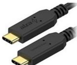
Obrázek 3: kabel USB-C