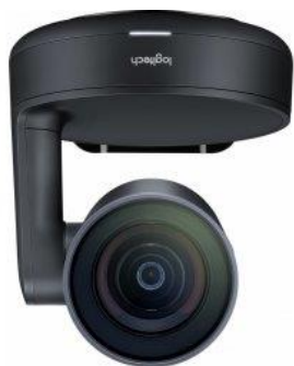
Obrázek 9: kamera Logitech

Při videokonferenci v MS Teams jsou vstupy z kamery a mikrofonu nastaveny jako výchozí. Pro nahrávání lze použít aplikaci „Kamera“, jejíž zástupce je umístěn na ploše.