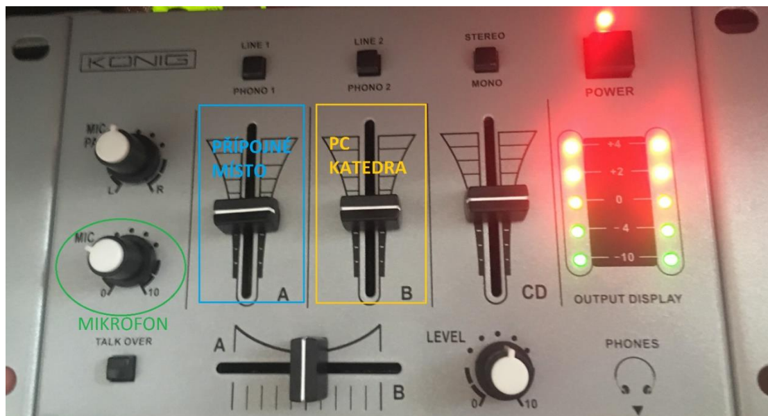
Obrázek 6: zvukový panel

Hlasitost mikrofonu (i hlasitost přípojného místa a katedry) lze upravovat na zvukovém panelu (obr. 6) ve skříni v pravé části katedry (pod tlačítky na ovládání plátna a zatemnění).