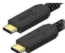
Obrázek 3: kabel USB-C