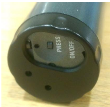
Obrázek 4: zapínání mikrofonu

V sále je dostupný mikrofon, který se zapíná stiskem tlačítka vespod mikrofonu.