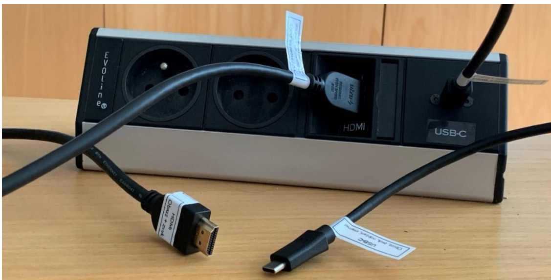
Obrázek 7: přípojné místo

Možnost připojení obrazu a zvuku kabelem HDMI nebo USB-C – viz označení na kabelu (rozhraní USB-C poskytuje navíc i připojení k internetu a nabíjení – max. 60 W).