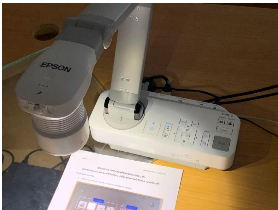
Obrázek 8: vizualizér

Vizualizér upravte do prezentační polohy – umístěte nad dokument, který chcete snímat – a zapněte modrým spouštěcím tlačítkem (vlevo na základně vizualizéru se symbolem ☺). Následně přepněte zdroj na ovládacím panelu (obr. 1) na „DOC CAM“.