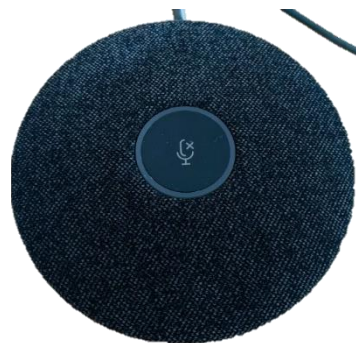
Obrázek 10: všesměrový mikrofon