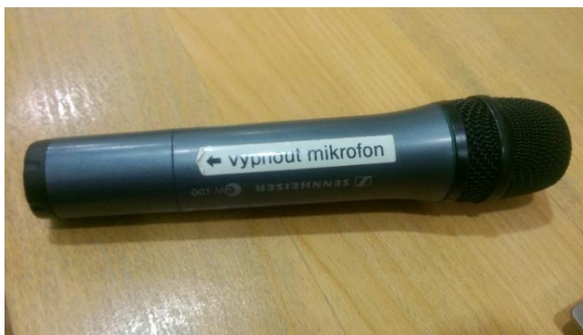
Obrázek 5: mikrofon

Pokud mikrofon nefunguje, s největší pravděpodobností je vybitá baterie. V takovém případě si vyzvedněte novou baterii u správkyňe budovy (první dveře před vrátnicí vpravo po vstupu do budovy), případně na vrátnici.