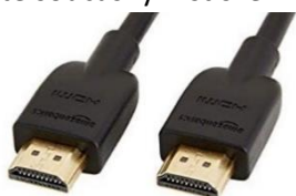
Obrázek 2: kabel HDMI