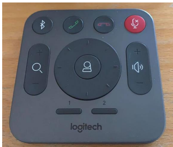
Obrázek 9: dálkový ovladač kamery

Kameru lze ovládat dálkovým ovladačem umístěným na katedře: