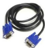
(obr. 1 – VGA kabel)

Po odpojení osobního notebooku, připojte opět kabel VGA do učitelského počítače! (kabel od internetu samozřejmě také, pokud jej zapojíte do svého notebooku)