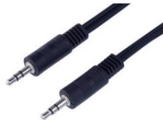
(obr. 3: 3,5mm stereo jack)