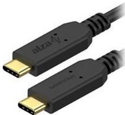
(obr. 2: USB-C kabel)