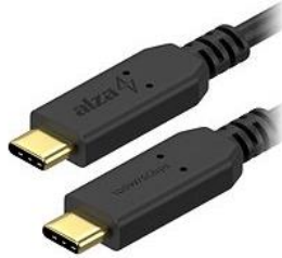
(obr. 2: USB-C kabel)