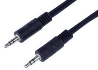
(obr. 3: 3,5mm stereo jack)