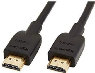
(obr. 1: HDMI kabel)