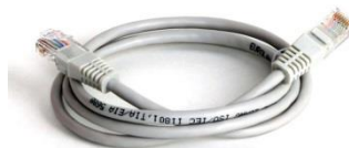
(obr. 4: Kabel RJ45)