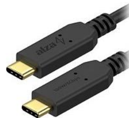
(obr. 2: USB-C kabel)