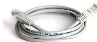
(obr. 3 - Kabel RJ45)