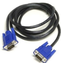
(obr. 1 – VGA kabel)